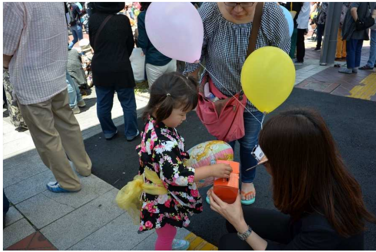
6月3日(日)ロータリーデー