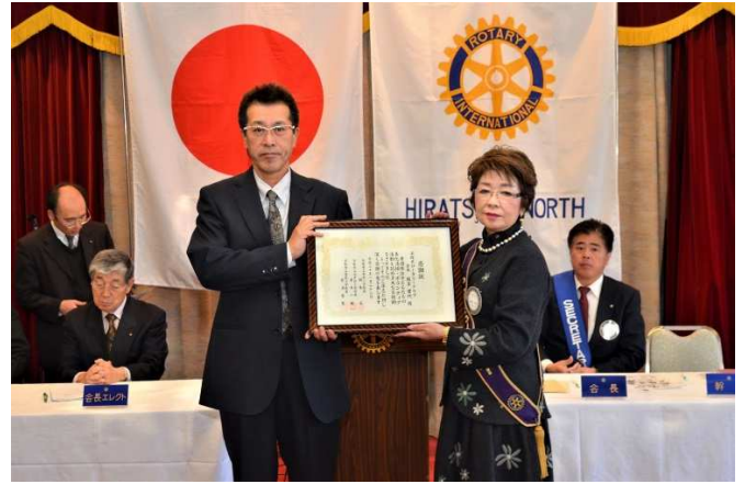
感謝状授与＝平塚北ロータリークラブ