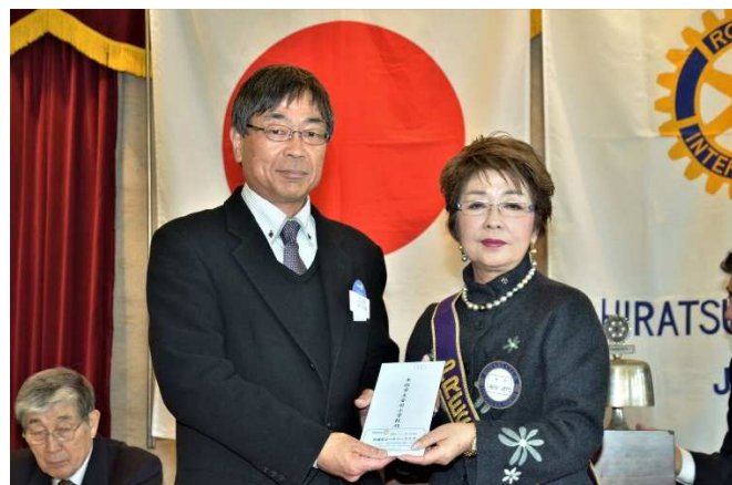
支援金授与＝金目小学校 上間教頭