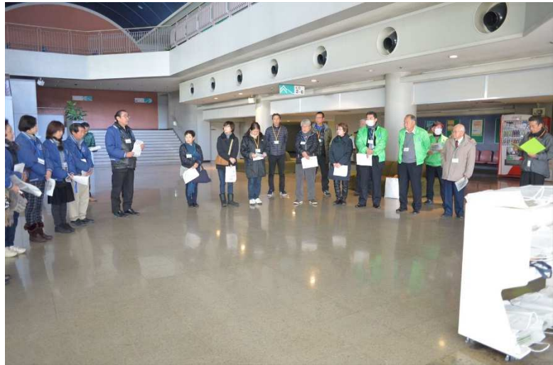
1月12日（金）協力スタッフ