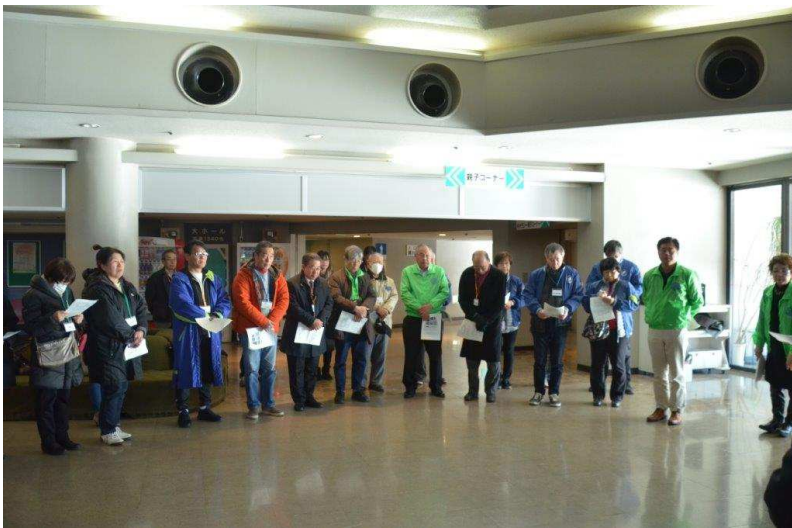
1月11日（木）協力スタッフ