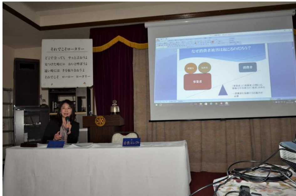
卓 話＝悪徳商法の手口と対処法