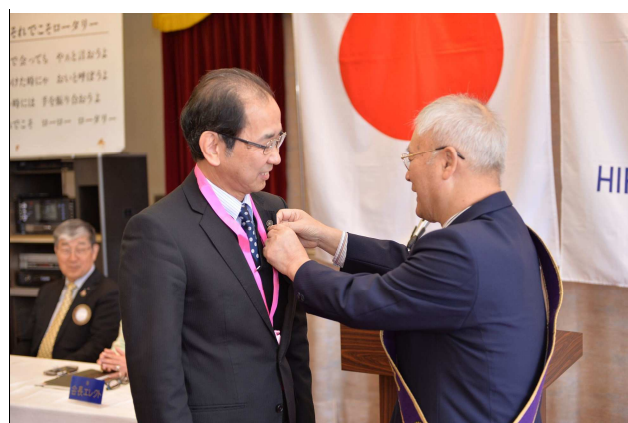
会長から会員章の贈呈