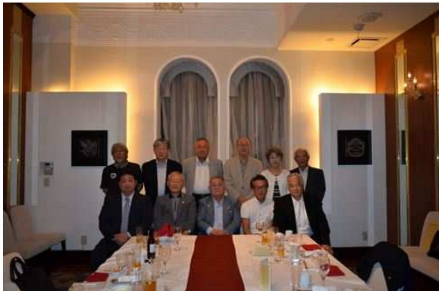
新旧理事役員打ち合わせ会 6月17日 バーチランド