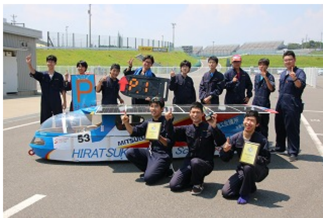
神奈川県立平塚工科高等学校 社会部 高校生クラス 6連覇