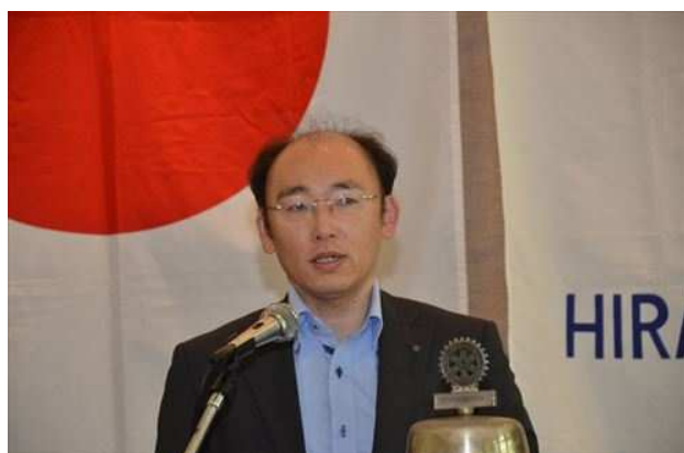
本日の卓話=金目川クリーンキャンペーン地区補助金について