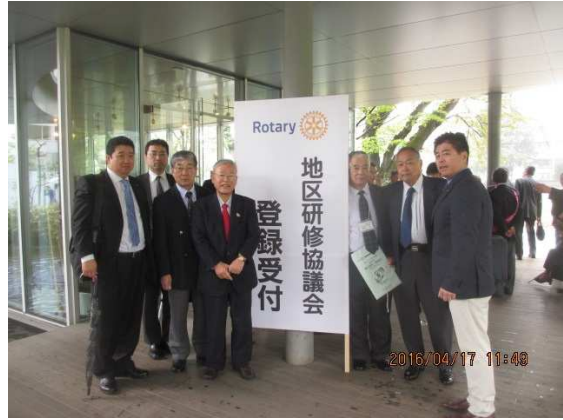
地区研修協議会出席者 (4月17日)