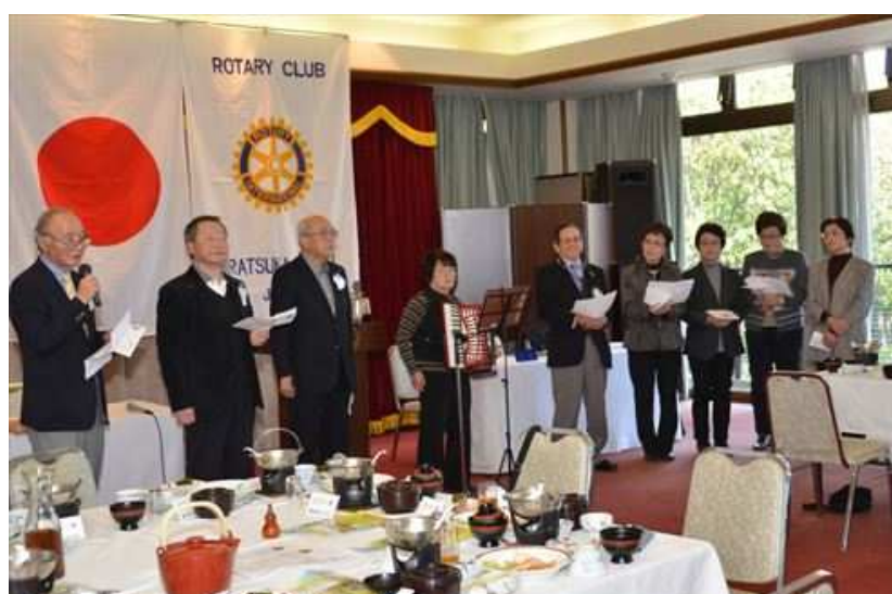
16会の皆様、本日は楽しいお時間をありがとうございました