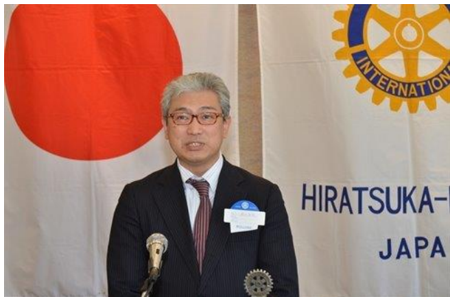
平塚子ども育成連絡協議会=磯田副会長